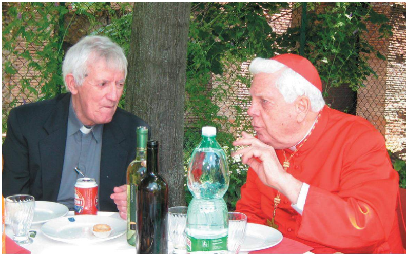
Il Padre Generale con il Cardinal Low durante la festa di S. Giovanni a Porta Latina

9 Maggio: il Cardinale Bernard Francis Law, in passato arcivescovo di Boston ed ora Arciprete di Santa Maria Maggiore, ha presieduto la Messa per le feste di S. Giovanni a Porta Latina. È poi rimasto con la Comunità e gli amici per il pranzo nel nostro giardino.