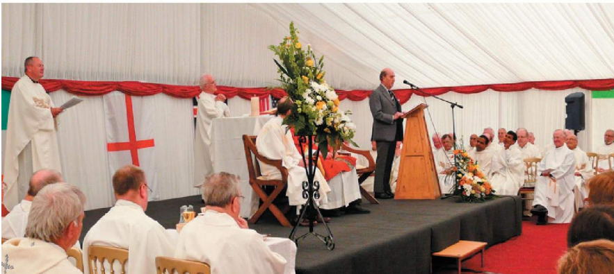
15 giugno: Inaugurazione della nuova Provincia Gentili a Grace Dieu alla presenza di confratelli provenienti dalle quattro aree dell'Istituto, delle suore, Ascritti, parrocchiani ed amici.

La vigilia della cerimonia è sempre incentrata sulla processione a luci di torcia dalla Villa Bolongaro, dove Rosmini morì e dove ora è installato il Centro di Studi rosminiani, su per il ripido colle alla chiesa del Collegio, dove il corpo di Rosmini giace nella sua cripta. A metà dell'ardua ascesa, si fa sempre una meritata pausa davanti al monumento che ricorda assieme Rosmini e il suo grande amico Alessandro Manzoni. Questa processione va sempre più assumendo l'aspetto di un corteo civico in onore del famoso figlio adottivo di Stresa. Il Sindaco, uno studioso di Rosmini, e alcuni della Giunta hanno sempre preso parte, ma gli inviti ora sono stati estesi alle autorità civiche di Rovereto (la città natale di Rosmini) e ad altri paesi connessi coi Rosminiani. Si è pensato che il prossimo anno la processione al chiaro delle torce, guidata dalle autorità civiche, possa aggirarsi per la città di Stresa piuttosto che aver il suo traguardo in Collegio.