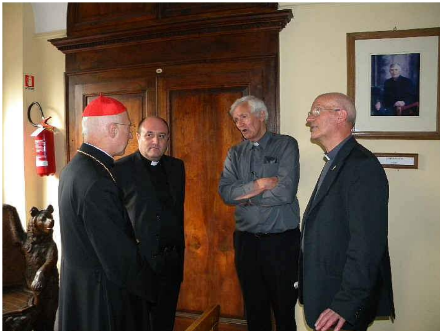
30 giugno 2010: insieme con il Cardinal Bagnasco al Calvario

pale dell'omelia, un tema che è stato costantemente attuale per la Chiesa e sottolineato da Papa Giovanni Paolo II e da Papa Benedetto XVI, fu il dialogo di Rosmini tra fede e ragione e come la vita incentrata su Cristo lo fece capace di sopportare le successive incomprensioni e sofferenze. (Come tutte le omelie e indirizzi del Cardinale, anche quella di Stresa si può trovare nel website della CEI, e una sintesi in Inglese è stata pubblicata nell'edizione di Zenit del 5 Luglio).